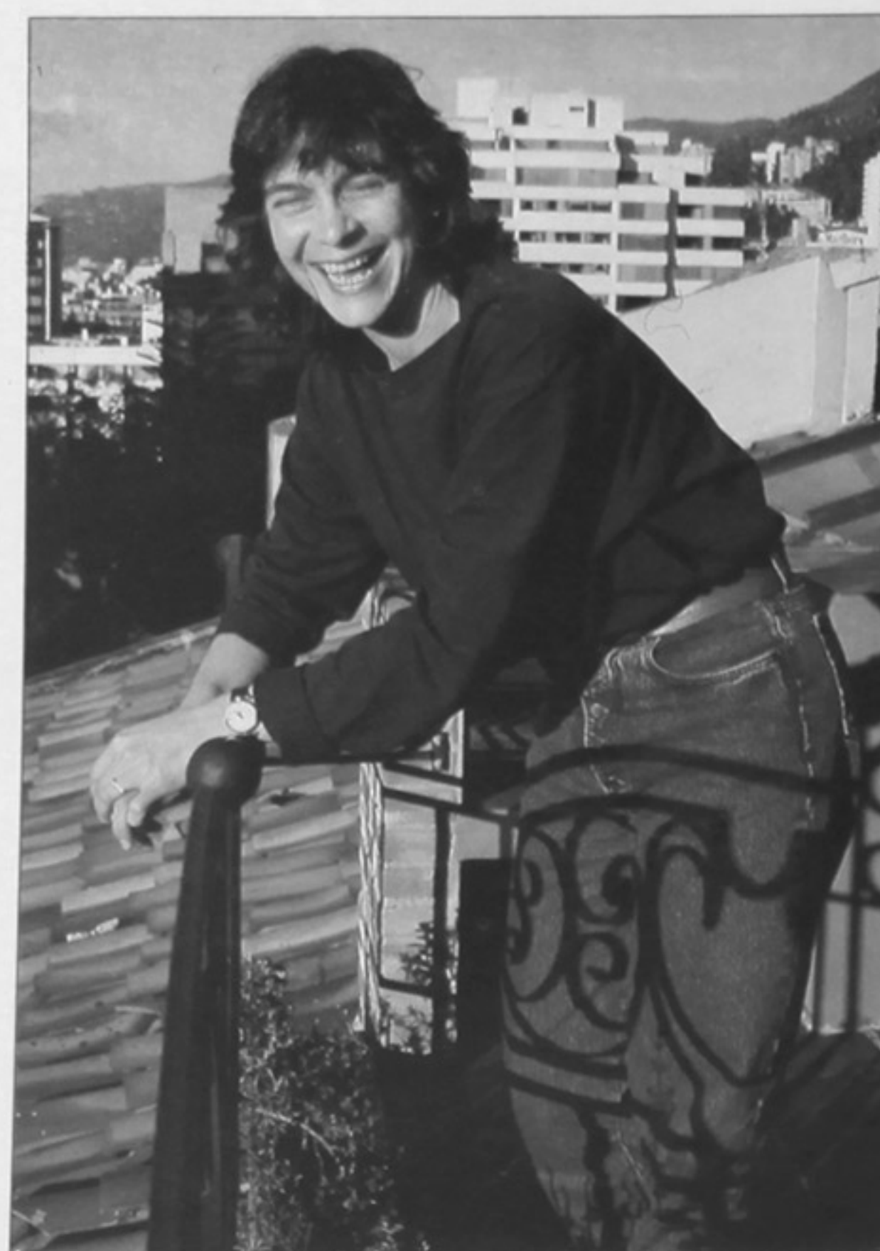
"Lo que más estrés me produce es salir al aire con mi trabajo".

Siempre sigue un mismo método de trabajo: se reúne con el director y éste le da las pautas necesarias, se lee el argumento, los libretos y entonces se ubica en la época de la historia, y se pierde del resto del mundo para hacer los arreglos, componer la música incidental —la que crea atmósferas— y la que identifica a cada personaje. Después se va al estudio y graba todo, y "en este punto llamo al director, lo invito a mi apartamento y le hago escuchar el trabajo ya configurado, corro el riesgo de que no le guste pero, por fortuna, nunca me han rechazado algo". Ella no cree en las musas de la inspiración, si bien reconoce que hay momentos en que las cosas salen más fluidas: "Soy mi